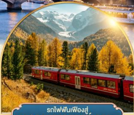
รถไฟฟันเฟืองสู่ยอดเขากรอนเนอร์เกรต