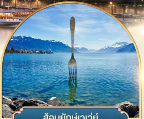
ล้อมยักเขาวัว