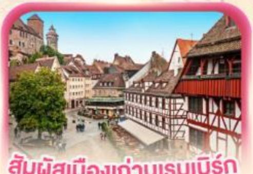
สัมผัสเมืองเก่าบูร์กแบร์ก