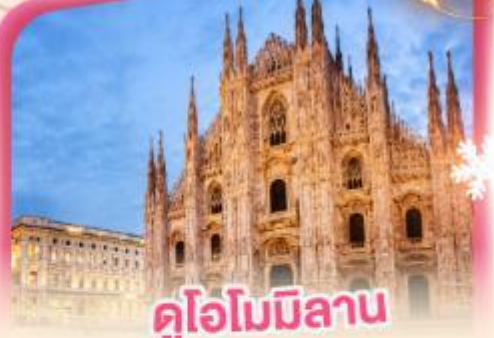
คู่อิมมิลาน