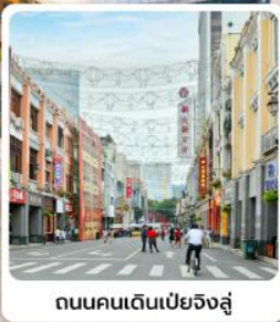
ถนนคนเดินเป่ย์จิงลู่