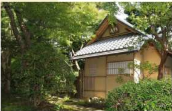
TEA CEREMONY AT SUIKOAN