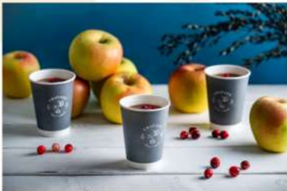
HAKUBA IWATAKE MOUNTAIN