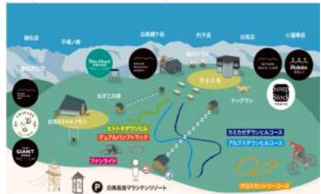
HAKUBA IWATAKE MOUNTAIN