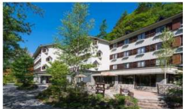
KAMIKOCHI LEMEIESTA HOTEL