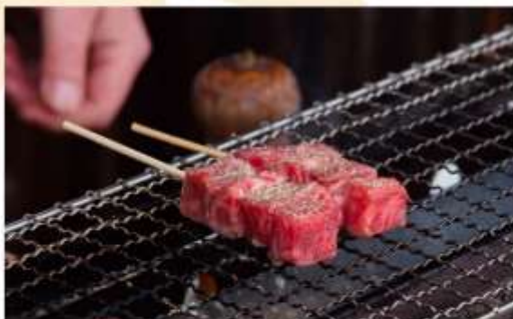
HIDA BEEF GRILLED