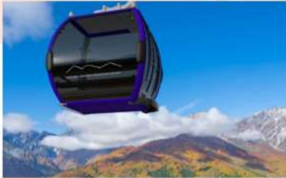
HAKUBA IWATAKE MOUNTAIN