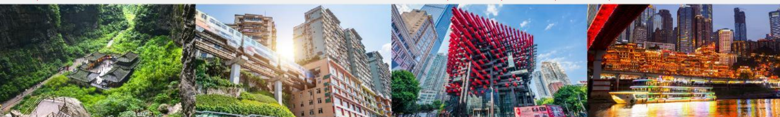
อุทยานแห่งชาติหลุมฟ้า 3 สะพานสวรรค์ รถไฟฟ้ากะลุดึก ตึกตะเกียบ หงหยาดัง

*ทางบริษัทฯ ขอสงวนสิทธิ์ในการสลับโปรแกรมทัวร์ตามความเหมาะสมขึ้นอยู่กับสถานการณ์หน้างาน โดยคำนึงถึงผลประโยชน์ของลูกค้าเป็นสำคัญ