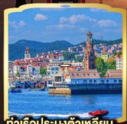
ท่าเรือประมงต้าเหลียน