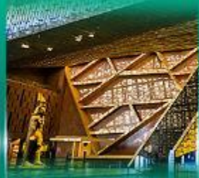
พิพิธภัณฑ์แกรนด์อียิปต์ (GEM)