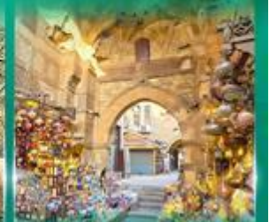
ตลาดผ่านเวลาอัลลี