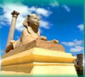
เสาสีเน่ย์มอเนย์