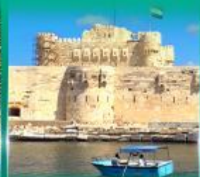
บึงนราการ Qait Bay