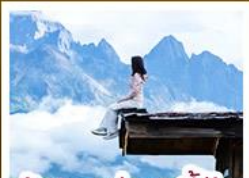
ร้านอาหารทะเลยูนตันอัน

ชมวิวภูเขาหิมะสวยสุดโรแมนติกกับแสงยามพลบค่ำ เที่ยวเมืองโบราณต้าหลี่ ลี้เจียง ไร่ชา แซงกรี่ล่า ชมวิถีชีวิตของชุมชนยูนนานและทิเบต พิสูจน์ความกล้าท้าเดินชมสะพานแก้วลี้เจียง • ซุปโปงเพลินที่ถนนคนเดินหนานผิงเจียง