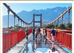
สะพานแก้วลี้เจียง