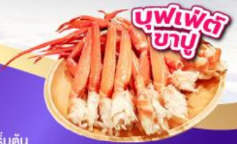
บุฟเฟ่ต์ 3 อย่าง