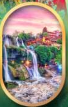
ฟูหลงเจินน้ำตก