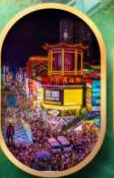
ถนนคนเดินซิงสู่