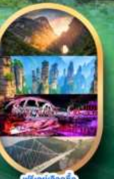
ฟรีคีย์เลือกซื้อ Option เสริม