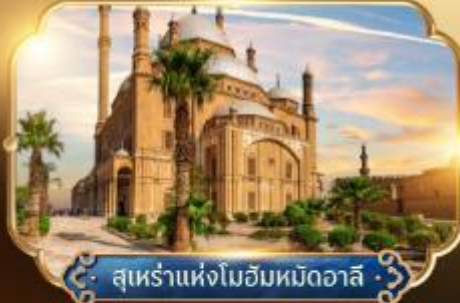
สุเหร่าแห่งโมฮัมหมัดอาลี