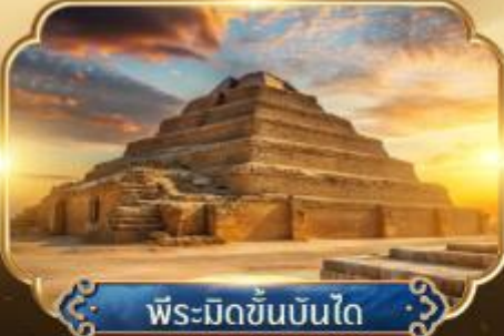
พีระมิดขั้นบันได