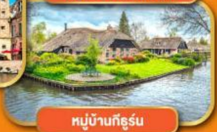
หมู่บ้านก็ธูร์น