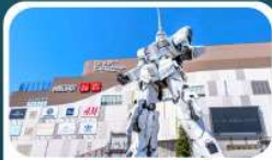
ห้างโดเวอร์ซิตี