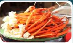
ชาบูบุฟเฟ่ต์