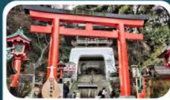
ศาลเจ้าอิโนะชิมะ

เดินทาง 01-05 ก.ค.69 15-19, 18-22 ก.ค.69