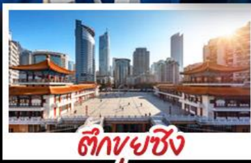
ตึกยูยซิง