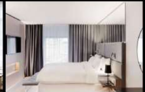
***รูปภาพเพื่อประกอบการโฆษณาเท่านั้น***