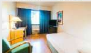
Single สำหรับ 1 ท่าน