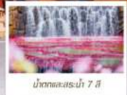
น้ำตกทะเลสาบไห่ 7 สี