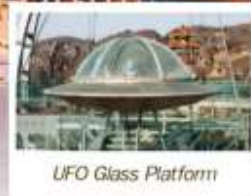
UFO Glass Platform