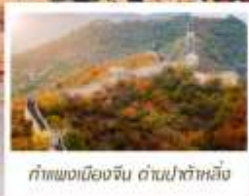
ท่าแพงเมืองจีน ด่านป่าต้าหลิ่ง