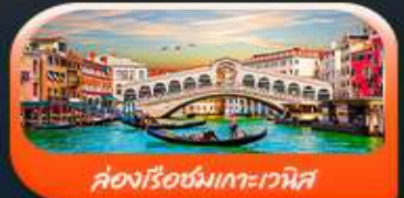
คลองเรือชมเกาะเวนิส