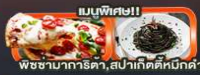
เมนูพิเศษ!! พิซซ่าการิตา, สปาเก็ตตี้หมักดำ