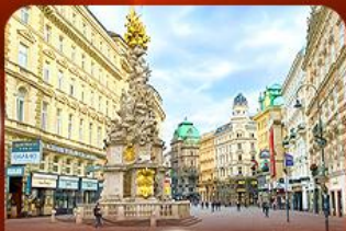
คาร์ทเนอวี สตรีท ออสเตรีย