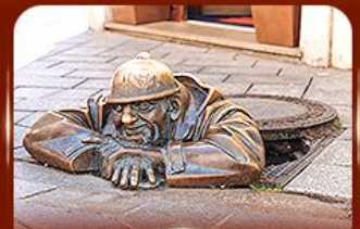
แลนด์มาร์คดัง รูปปั้นคูมิล ปราก สโลวาเกีย