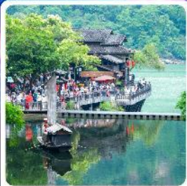
หมู่บ้านชาวน้ำเสี่ยเหรินเจีย