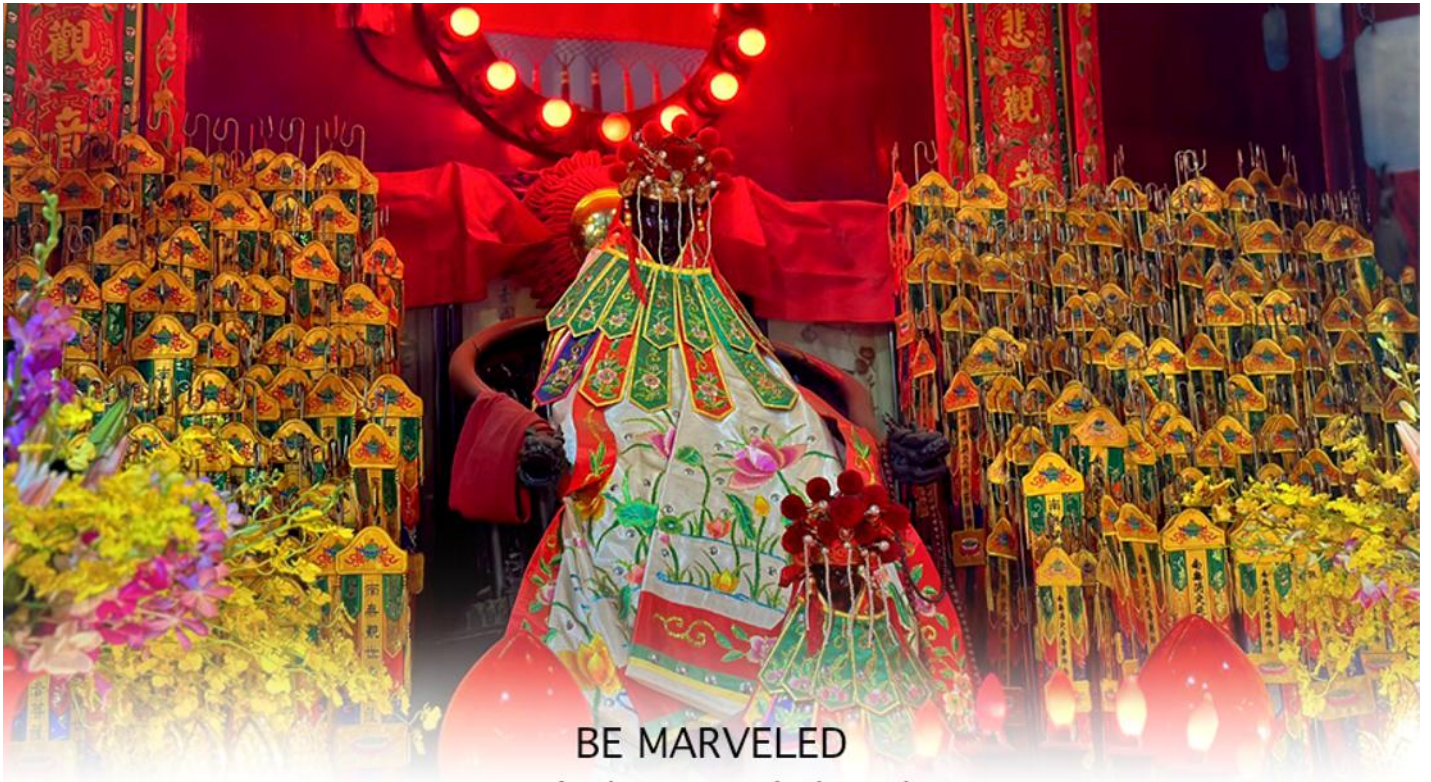
BE MARVELED วัดเจ้าแม่กวนอิมฮวงอ้า (ยิมจิน)

ให้เดินทางกลับไปกราบไหว้ และขอบคุณเจ้าแม่กวนอิมอีกครั้ง โดยเตรียมชุดไหว้ และกระดาษาเงินกระดาษาทอง ที่เป็นเหมือนเงินที่เรานำมาคืน เป็นการไหว้เพื่อคืนเงินเจ้าแม่กวนอิมนั่นเอง