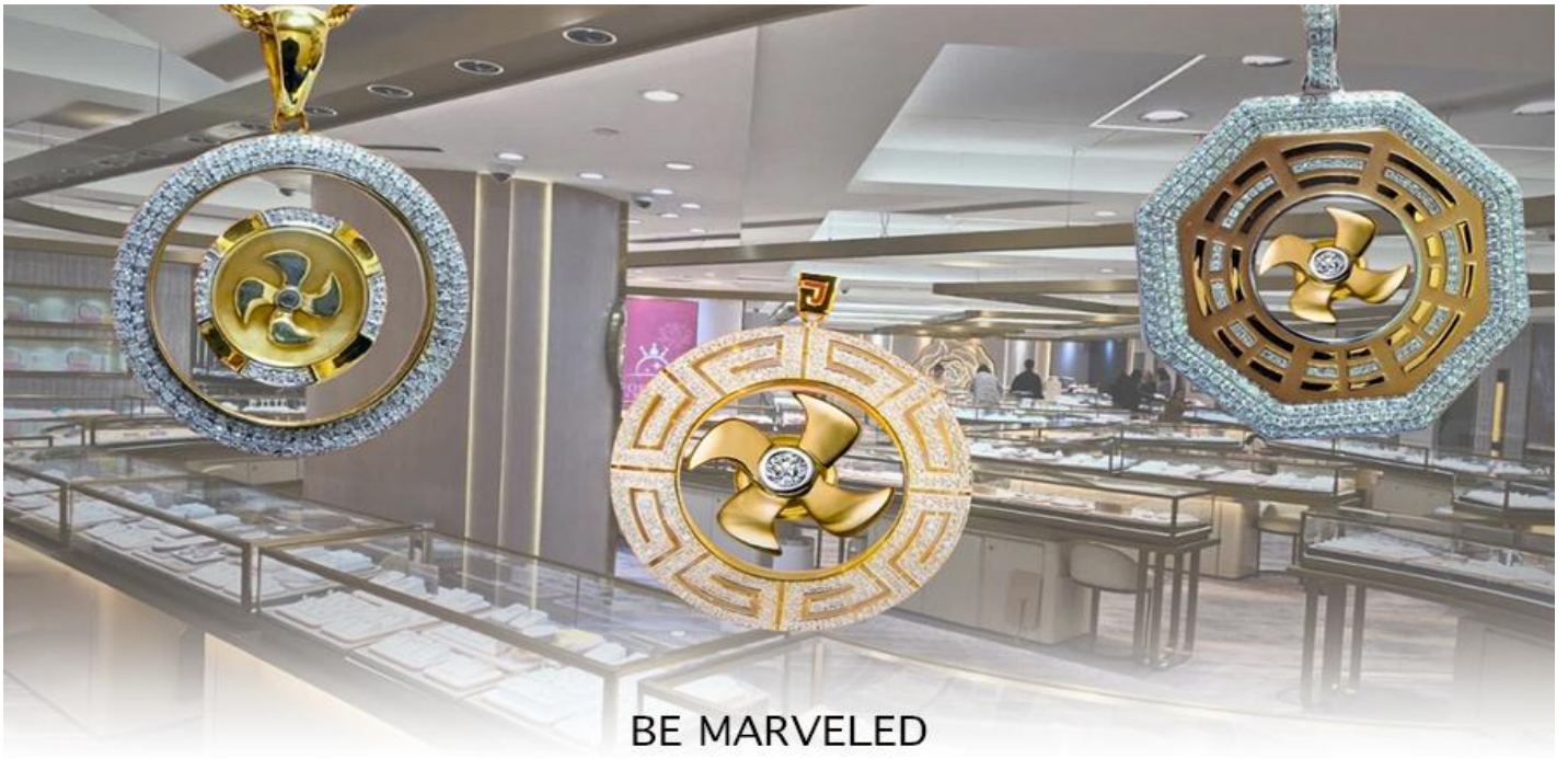
BE MARVELED ศูนย์ฮวงจุ้ย กัมพันนครบุรี

และนำท่าน ชม ศูนย์ปี่เซี่ยะ ซึ่งคนจีนนั้น ถือว่าหยกเป็นหิน ที่เป็นตัวแทนของความสวยงามและความบริสุทธิ์ มีความเชื่อว่าหยก มงคล ถ้าพกติดตัวไว้จะอายุยืนและสุขภาพดีมีสินค้ามากมายเกี่ยวกับหยก อาทิ กำไลหยก หรือ สัตว์นำโชคอย่างปี่เซี่ยะ ให้ท่าน ได้เลือกซื้อเป็นของฝาก, ของที่ระลึก หรือของนำโชคแต่ตัวท่านเอง