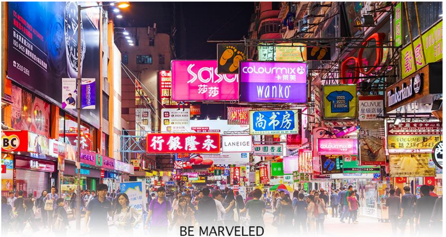
BE MARVELED TSIM SHA TSUI