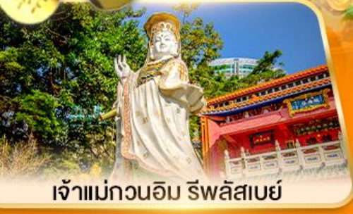
เจ้าแม่กวนอิม ธิพลสเบย์