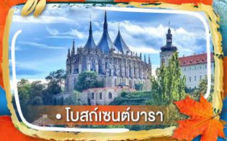
• โบสถ์เซนต์บารา

06-13, 09-16 ต.ค. 69 29 พ.ย. - 06 ธ.ค. 69 05-12 ธ.ค. 69 28 ธ.ค. - 04 ม.ค. 70