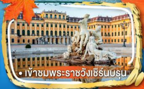
• เข้าชมพระราชวังเซิร์นบรุน