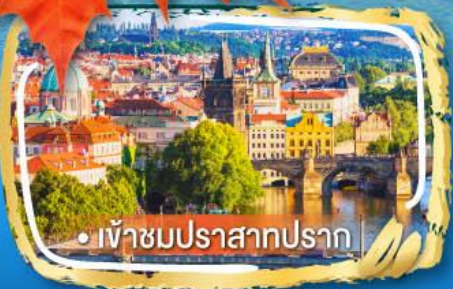
• เข้าชมปราสาทปราก