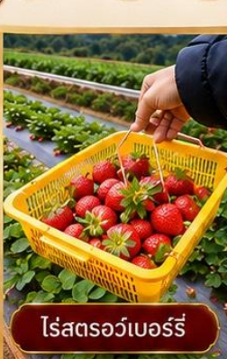
ไร่สตอร์วเบอร์รี่