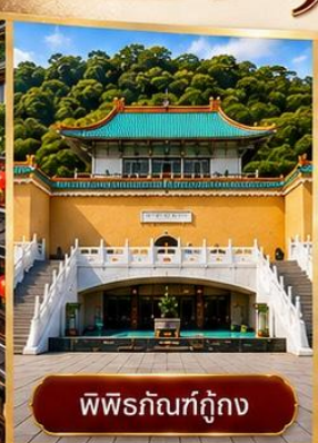
พิพิธภัณฑ์กู่กวง