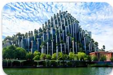
ต้นไม้พันต้น