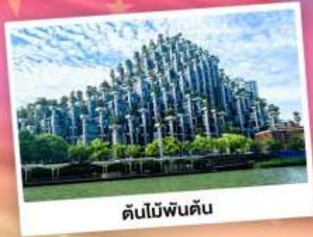
ต้นไม้พันต้น