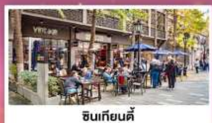
ช้อปปิ้ง