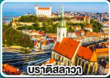
ปราทิสลาวา