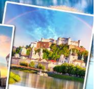
ชาลส์บวร์ก

เที่ยวหมู่บ้านฮิลสติกที่สวยงามที่สุดในโลก เข้าชมความงดงามภายในของปราสาทน้อยชวานสไตน์