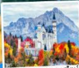
ปราสาทน้อยชวานสไตน์

09-15, 12-18 เม.ย. 69 26 เม.ย.-02 พ.ค. 69 29 เม.ย.-05 พ.ค. / 30 เม.ย.-06 พ.ค. 69 02-08 พ.ค. / 24-30 มิ.ย. 69 02-08, 16-22 ก.ย. 69