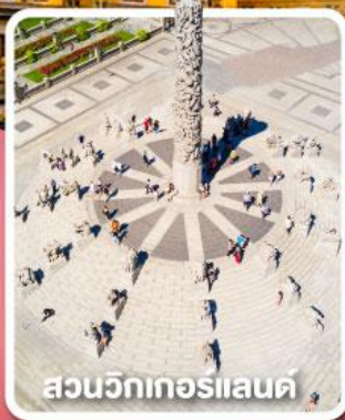
สวนวิกเตอร์แลนด์