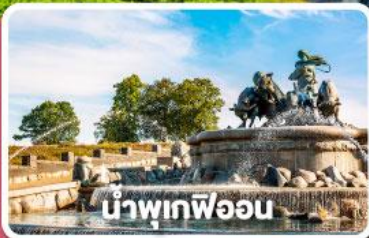
น้ำพุเทพีออน

พิเศษ พิกัดคืนเรือสำราญ DFDS พร้อมมื้ออาหาร Scandinavian Buffet