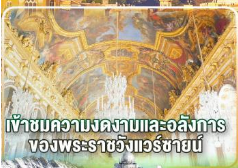
เข้าชมความงดงามและอลังการ ของพระราชวังแวร์ซายน์