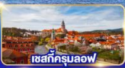
เชสกีครุมลอฟ