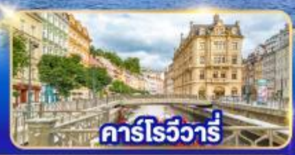
คาร์โรวัวร์