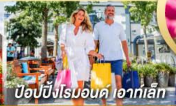
ป๊อปบิงโรมอนด์ ไอท์เล็ก