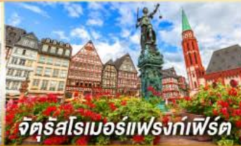
จัตุรัสโรเมอร์เฟรงก์เฟิร์ต