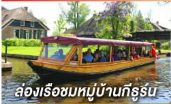
ล่องเรือชมหมู่บ้านทิวลิป